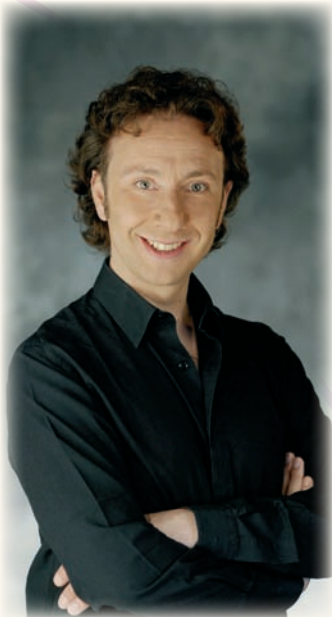
soirée spéciale présentée par Stéphane Bern

F rance 3 rend hommage à S.A.S. la Princesse Grace de Monaco à l'occasion du 25 e anniversaire de sa disparition, le 14 septembre 1982, en proposant une soirée spéciale, à 20h50, présentée par Stéphane Bern avec la participation exceptionnelle des membres de la famille souveraine : S.A.S. le Prince Souverain Albert II et sa sœur, S.A.S. la princesse Stéphanie.